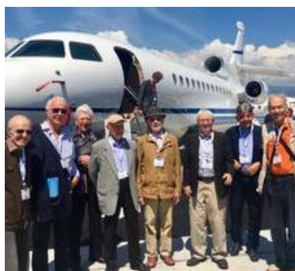
Acht Alumni besuchen den Flughafen Genf Cointrin.