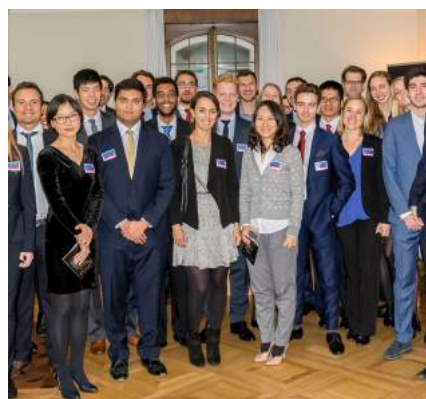
Treffen von 30 Studierenden und Doktoranden der EAEM Alumni.