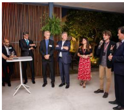
Im Laufe der letzten Jahre hat sich eine gute Zusammenarbeit mit Swissnex São Paulo entwickelt.

9 Website-Link www.alumni.ethz.ch/saopaulo →