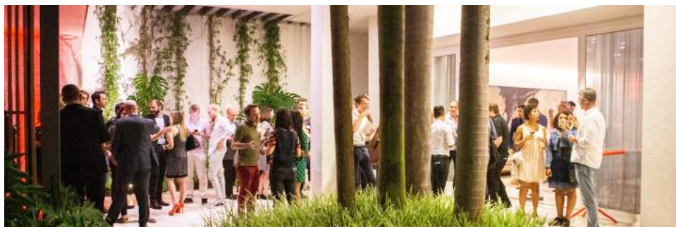
Swissnex São Paulo lud im Dezember im Rahmen des Swiss Alumni 2018 zu einem vorweihnachtlichen Cocktail ein.

man neue Leute mit unterschiedlichstem Hintergrund kennen. Die daraus entstehenden Gespräche und Kontakte sind interessant und anregend.»