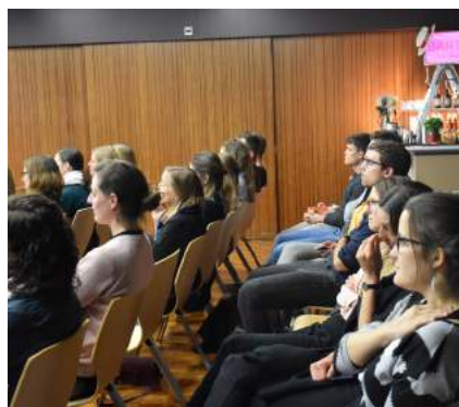
An der Feier zum 10-jährigen Jubiläum hörten die Teilnehmenden einen Vortrag zum Thema «E-Health».