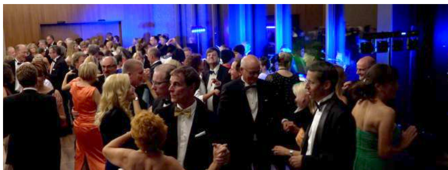
Der diesjährige Alumni Ball fand zusammen mit dem OG Chapter Zug Alumni im neu eröffneten Bürgerstock in Luzern statt.