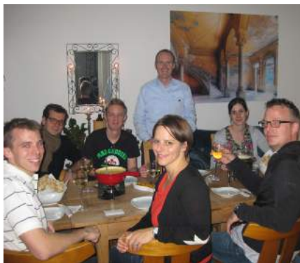
Jahrestreffen 2018 in München beim Fondue-Essen.

9 Website-Link www.alumni.ethz.ch/muenchen →