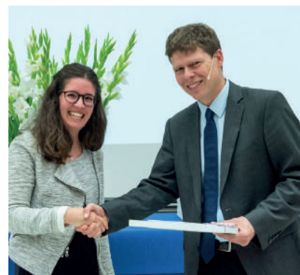
Wir halten die Diplomübergabe jeweils auch fotografisch fest.

auch später noch daran, dass sie Teil dieses weltweit tätigen Netzwerks sind.