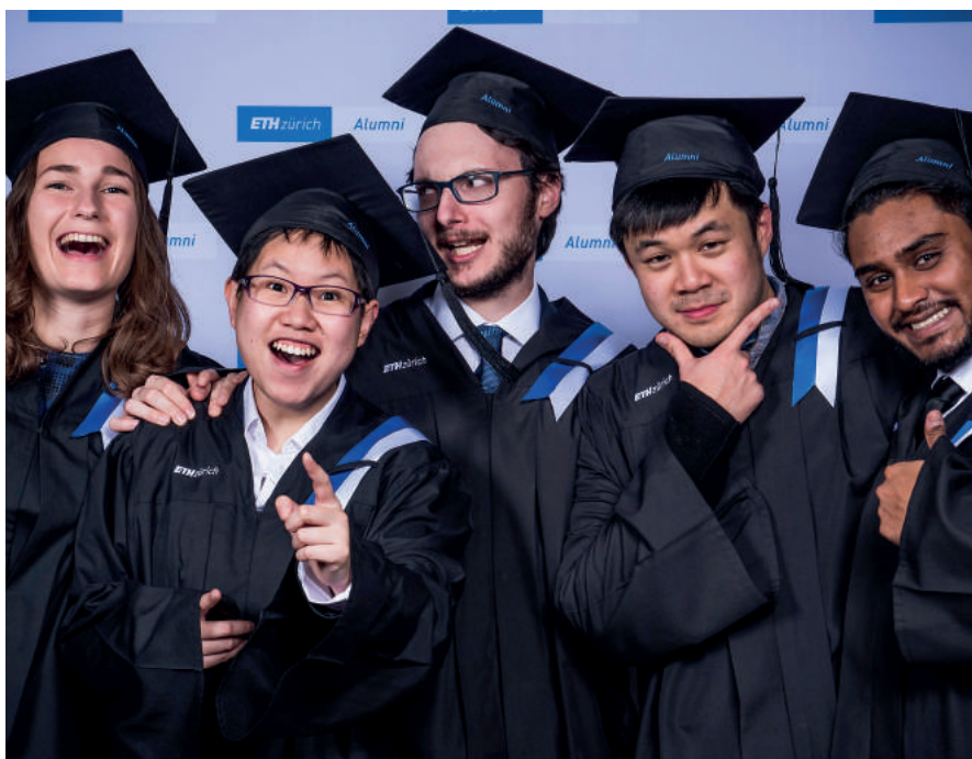
Wir sind an den Masterfeiern mit einem Talarshooting vor Ort und stellen uns vor.

Ein besonderes Highlight für die Absolventen ist es, wenn es am Anlass ein Talarshooting gibt: Sie ziehen sich die Robe und den Hut an, posieren alleine, in der Gruppe, mit der Familie und Freunden. Einige haben so viel Spass, dass sie gleich mehrmals posieren, hüpfen oder sich umarmen. Die Mitarbeitenden der ETH Alumni haben dann alle Hände voll zu tun: ankleiden, Fotos machen, Flyer verteilen, über die ETH Alumni informieren, entkleiden. Die Absolventen erhalten Zugang zu diesen Fotos und können diese in hoher Auflösung herunterladen. Das Angebot wird von den Studierenden