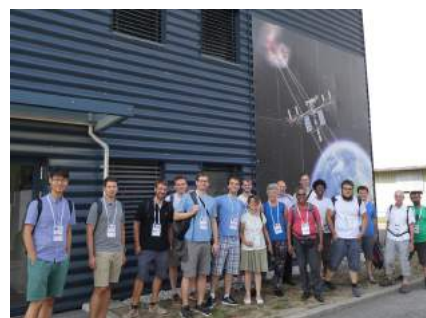
Knapp 20 Alumni geniessen die Kühlung des Hadronenbeschleunigers im CERN.