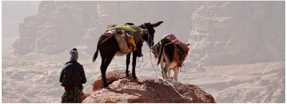
Die diesjährige Alumni Reise nach Jordanien war ein voller Erfolg.

Der Verein Ortsgruppe Euregio Bodensee löste sich auf und die noch aktiven Mitglieder wurden in die Vereinigung integriert. Ebenfalls löste sich das Alumni Chapter Seoul auf. MAS Raumplanung Alumni bestand noch aus 28 Mitgliedern, welche nach der Auflösung in die Gruppe der REIS Raumentwicklung und Infrastruktursysteme Alumni aufgenommen wurden. Der Verein der BioAlumni hat ausserdem entschieden, sich per 31.12.2018 aufzulösen und ab 1.1.2019 Bestandteil der ETH Alumni Vereinigung zu werden.