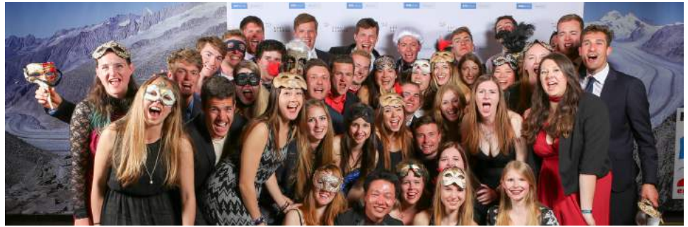
Challenge: Die Challenge Alumni trafen sich wie jedes Jahr auch 2018 unter dem «Challenge Spirit».

in einer unvergesslichen Atmosphäre durchgeführt und fördern Freundschaften, Kontakte und das Netzwerk der Repräsentanten der jeweils anderen Hochschule jenseits des «Röstigrabens».