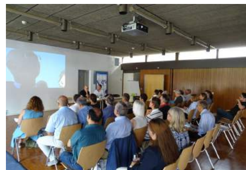
Am Alumni Forum diskutieren die Mitgliederorganisationen, der Vorstand und die Geschäftsstelle über die nächsten Schritte.

Insgesamt sind wir mit dem Ergebnis zufrieden und stellen fest, dass die operative Qualität einen Lernpfad durchläuft, welcher Jahr für Jahr Ergebnisverbesserungen brachte. Damit hat sich die ETH Alumni Handlungsspielraum für strategische Initiativen erarbeitet. Das Wachstum der finanziellen Eckdaten spiegelt sich auch im Wachstum der Organisation wieder. Dem zusätzlichen Arbeitsaufwand wollen wir mit Optimierungen und punktuell gezielten personellen Verstärkungen begegnen. Der eingeschlagene Weg soll somit weiterverfolgt werden, damit für die strategische Weiterentwicklung der Organisation genügen Mittel vorhanden sind.