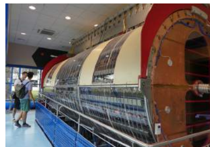
CERN-Besichtigungstour durch die internationale Forschungs-Grossanlage an der Grenze zu Frankreich.