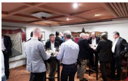
Am September-Stamm der Process Alumni wurden Fragen zur Altersvorsorge diskutiert.