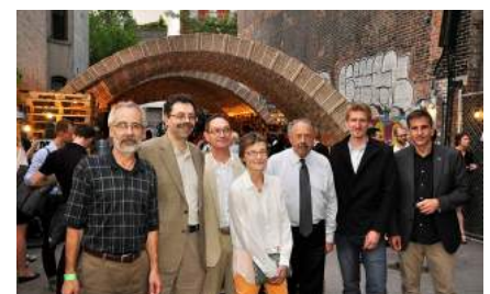
Anlässlich des IDEAS CITY Festival in New York traf sich das New York Chapter.