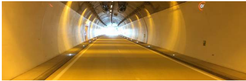
Die GEP Luxembourg Alumni besuchte am 18. September den neu eröffneten Autotunnel Nordstroos, der moderne Architektur mit Kunst in der Landschaft verbindet.