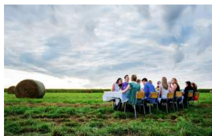
Die Agri-Food Alumni verbinden Absolventen der Agrar- und Lebensmittelwissenschaften.