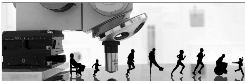
Im Okt. 2015 feierte die ETH Alumni Fachgruppe «Health Sciences & Technology (HST)» ihre Umbenennung von «Bewegungswissenschaften» zu «Health Sciences & Technology (HST)».