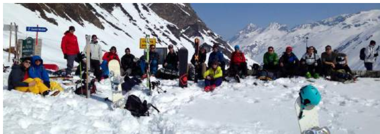
Die ETH seniors bei der gemeinsamen Skitour auf die Dreiländerspitze.