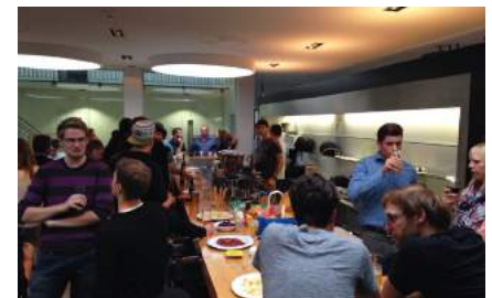
Gründungsapéro der Biotech Alumni in der Science Lounge des D-BSSE in Basel.