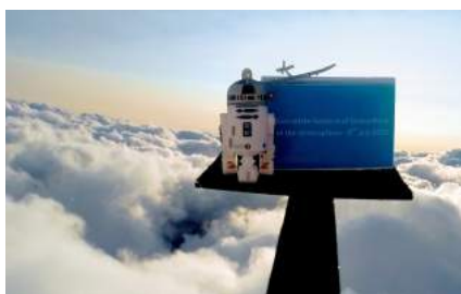
Mit dem Schweizer Konsulat liess das München Chapter einen Stratosphärenballon fliegen.