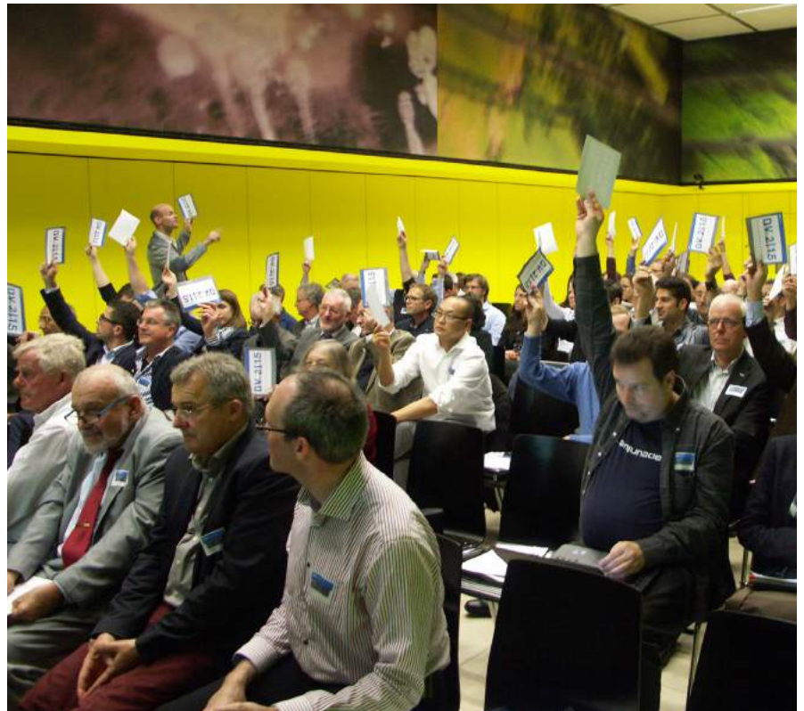
An der Delegiertenversammlung vom November nahmen die Delegierten der Mitgliederorganisationen und der Direktmitglieder die neuen Statuten der Vereinigung an.