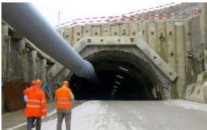
Die OG Bern besuchte bei einer Exkursion den baulich anspruchsvollen Rosshäuserntunnel.