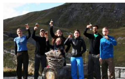
Der Vorstand der Umwelt Alumni (n. vollst.), die 2015 das 15-jährige Bestehen feierten.