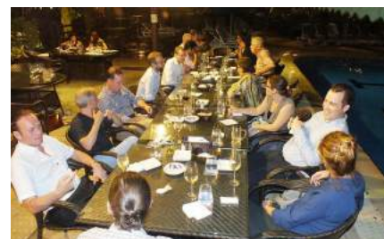
Der Swiss Club gab 2015 den Rahmen für den Racletteplausch des Singapore Chapters.