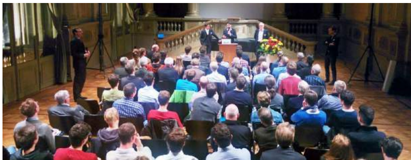
Die jährliche Math-Phys Lecture, 2015 zum Thema «Bitcoin - flip oder flop?», lockt jedes Jahr eine grosse Anzahl an Math-Phys Alumni in die Semperaula.