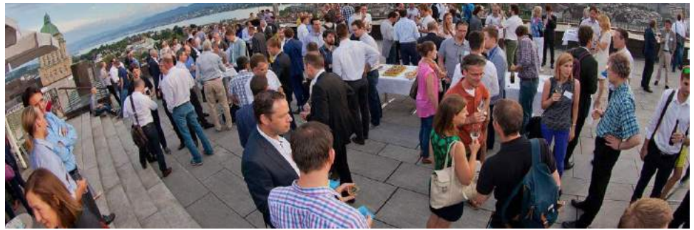
Am 26. Juni 2015 feierten 275 Personen das 35-jährige Bestehen des Studiengangs (früher NDS BWI), davon das 10-jährige Bestehen als MAS MTEC sowie das 10-jährige Jubiläum der MAS MTEC Alumni.

den HSG Alumni sowie anderen Alumni-Gruppen in Singapur. Kontaktpflege mit dem Wissensschafts- und Technologiebüro der Schweizer Botschaft in Singapur.