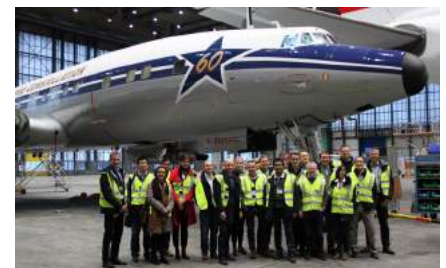
Bei der Exkursion zu SR Technics trafen sich die MBA SCM Alumni zum Jahresendevent.

10 Website-Link www.alumni-mba-scm.ethz.ch