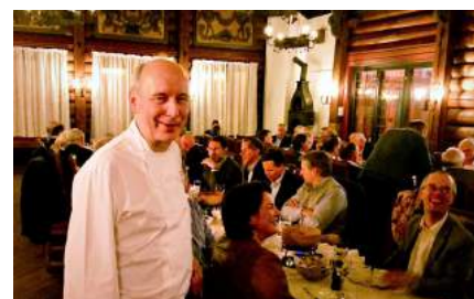
Jahresversammlung des Alumni Chapters Norge mit Chäsfondue, Fendant und Kirsch.