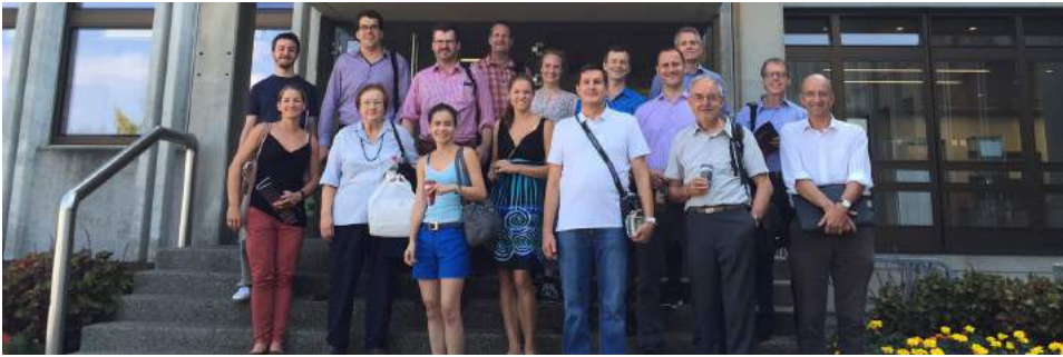
20 Bio Alumni machten sich am 14. September auf nach Spiez, um das Kompetenzzentrum ABC KAMIR mit dem Abwehr-Labor 1 der Schweizer Armee zu besichtigen.