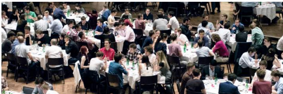
Zusammen mit dem VIS lud der IAETH am 24. September seine Mitglieder ins Kongresshaus Zürich ein, um das gemeinsame Jubiläum (IAETH 20 Jahre und VIS 32 Jahre) zu feiern.