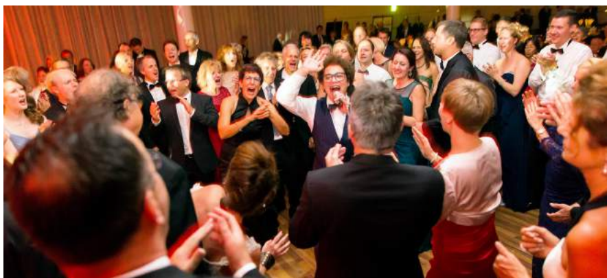
Rauschende Alumni-Ballnacht im The Dolder Grand unter dem Motto «Swing with me sway with me» – Highlight war Marc Sway, der die Gäste mit seiner Musik von den Stühlen fegte.

Dass die ETH Alumni Vereinigung ihren Mitgliedern ein äusserst aktives Vereinsleben bietet, zeigen die zahlreichen Events, die über das ganze Jahr rund um den Globus stattgefunden haben. Zusammen haben die Mitgliederorganisationen über 250 Events organisiert. Vom Stammtisch bis hin zu 100-Jahr-Jubliäums-Feiern war alles dabei. Auch die Geschäftsstelle bot wieder ein attraktives Angebot an Events. Knapp 50 Veranstaltungen in den Bereichen Career-, Focus-, Inside- sowie Society-Events fanden grossen Anklang unter den Mitgliedern. Höhepunkt war der Alumni-Ball vom 1. Oktober im The Dolder Grand zum Motto «Swing with me sway with me». Highlights waren Marc Sway, der das Publikum von den Stühlen fegte, sowie This Masquerade, die das musikalische Rahmenprogramm boten. Die zahlreichen Gäste genossen den Abend und tanzten bis tief in die Nacht.