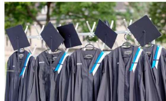
Die ETH Alumni Vereinigung ist jeweils an den Masterfeiern mit dem beliebten Talar-Fotoshooting vor Ort, das kostenlos zur Verfügung gestellt wird.

Die Projektrechnung zeigt weitgehend ausgeglichene Ergebnisse, teilweise sogar leichte Überschüsse: Focus Events CHF 5'732, Society Events CHF 6'580 und Career Events CHF 7'682.