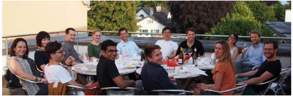
Wine Tasting über den Dächern von Zürich: Neben einem feinen Glas Wein erhalten die Alumni die Möglichkeit, sich besser kennenzulernen, ganz nach dem Motto «Ein guter Wein bereichert manchen Moment».