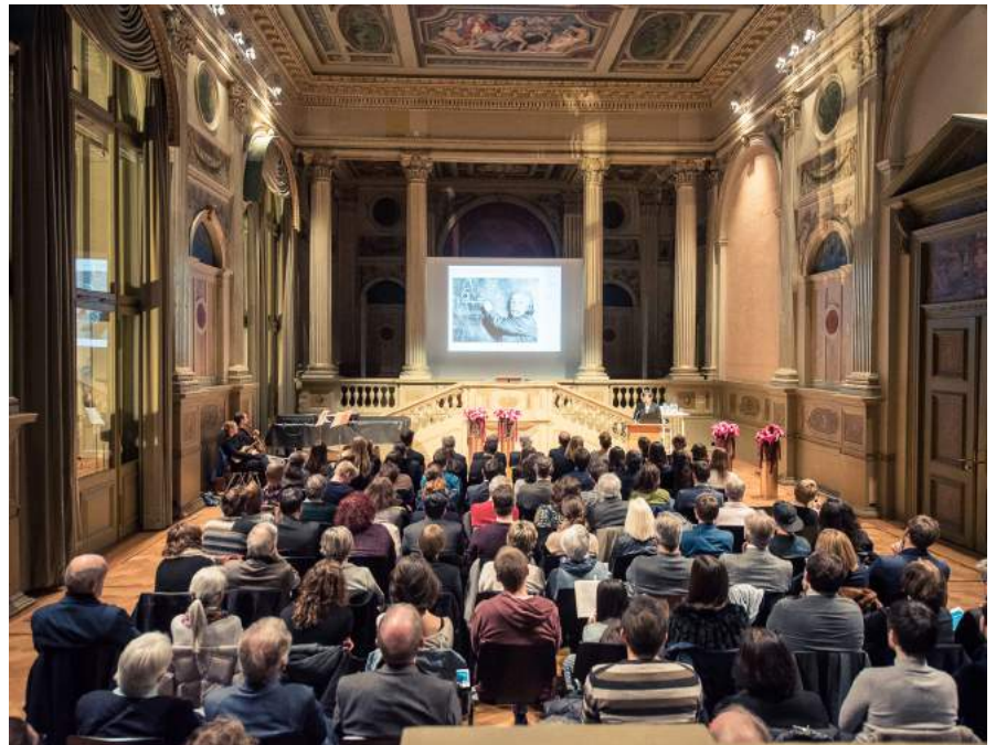
Masterfeier 2016 der Absolventen in Geistes-, Sozial- und Staatswissenschaften in der Semper Aula.