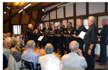
Die Ortsgruppe Basel Alumni feierte ihr 100-jähriges Bestehen und lud zum festlichen Beisammensein. Im Zentrum der Feierlichkeiten standen die Basler Traditionen.