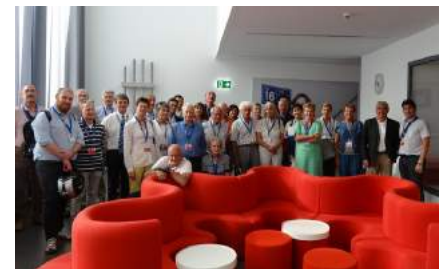
Am 9. September lud die Ortsgruppe Ticino Alumni zum Besuch der Betriebszentrale Süd der SBB in Pollegio ein.