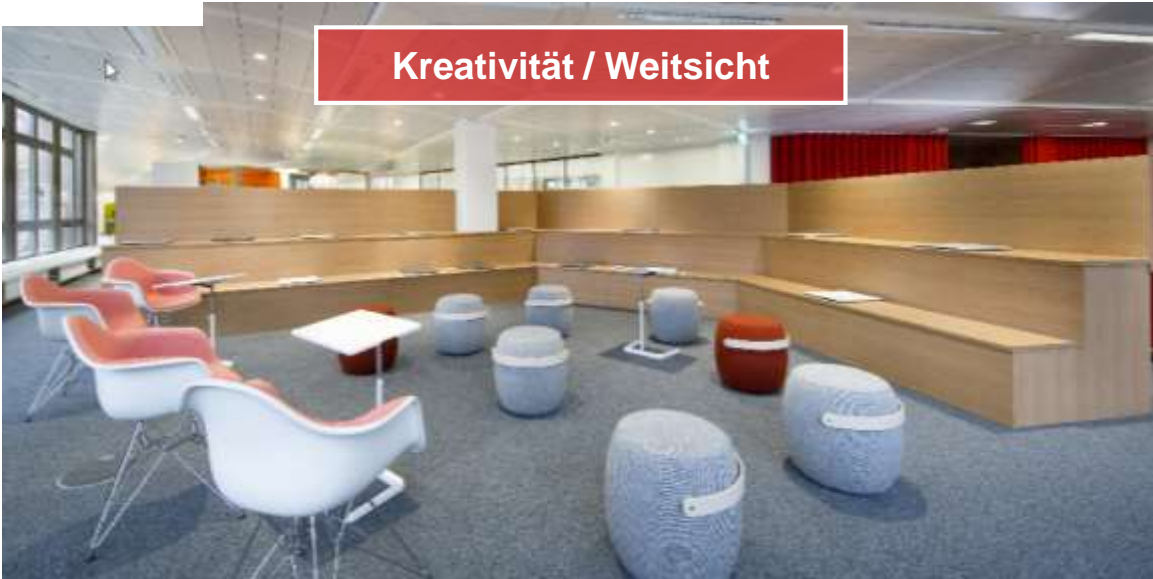
Kreativität / Weitsicht