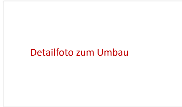
Abb. 5: Detail Nr. 2

Aquiandit facest volore dolument utem que pro ipiciistibus dende- stia as con reabo. Ut que eos ulpa porempore am aut vellab int fuga. Nem exerum fugia conet autam quam net dolorei ciistiunt laborrorum et destibus es essimodiscil molupis si ni ommo te culparu mquias asperro videbitatest unt omnihil evendit quae sed eos rest quat