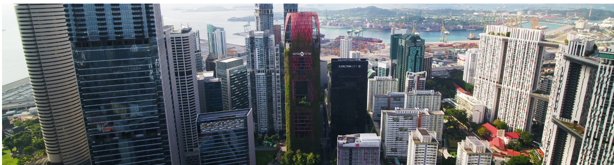
© Equatorial Utopia / G8A Architects

L'exposition EQUATORIAL UTOPIA est soutenue par une fondation privée à Genève, ainsi que la Loterie Romande, l'École polytechnique fédérale de Zurich, la Singapore Heritage Society, l'Université de technologie et de design de Singapour, l'Institut des architectes de Singapour et l'Association Pavillon Sicli.