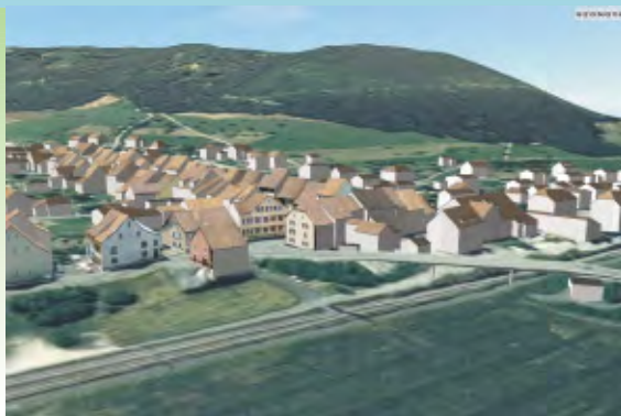
3-D- Städtmodell für Raumplanung und Tourismus

Fächer im Bachelorstudium: Mathematik, Mechanik, Informatik, Geologie, Ökologie, Systems Engineering, Betriebswirtschaftslehre, Geodätische Messtechnik, Physik, Hydraulik, Hydrologie, rechtliche Grundlagen, Geometrie und Computergrafik; Einführung in die Schwerpunktsgebiete der Geomatik und Planung: Geodäsie und Navigation, Geografische Informationssysteme (GIS), Kartografie, Landnutzung und Landentwicklung, Parameterschätzung, Photogrammetrie und Fernerkennung, Umweltplanung und Standortmanagement. Der Bachelorabschluss in Geomatik und Planung eröffnet den direkten Zugang zum Masterstudium in Geomatik und