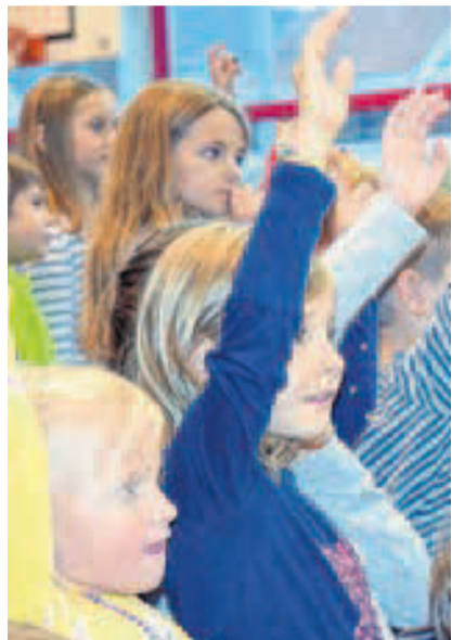
Die Kinder wählen das «Rüebli» zum leckersten Gemüse.

Urchig: Schwyzerörgäli- und Muulörgeli-Obig in Wangen. SEITE 9