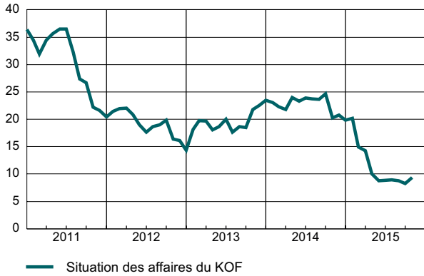
KOF Indicateur de la situation des affaires (Solde, valeur désaisonnalisée)