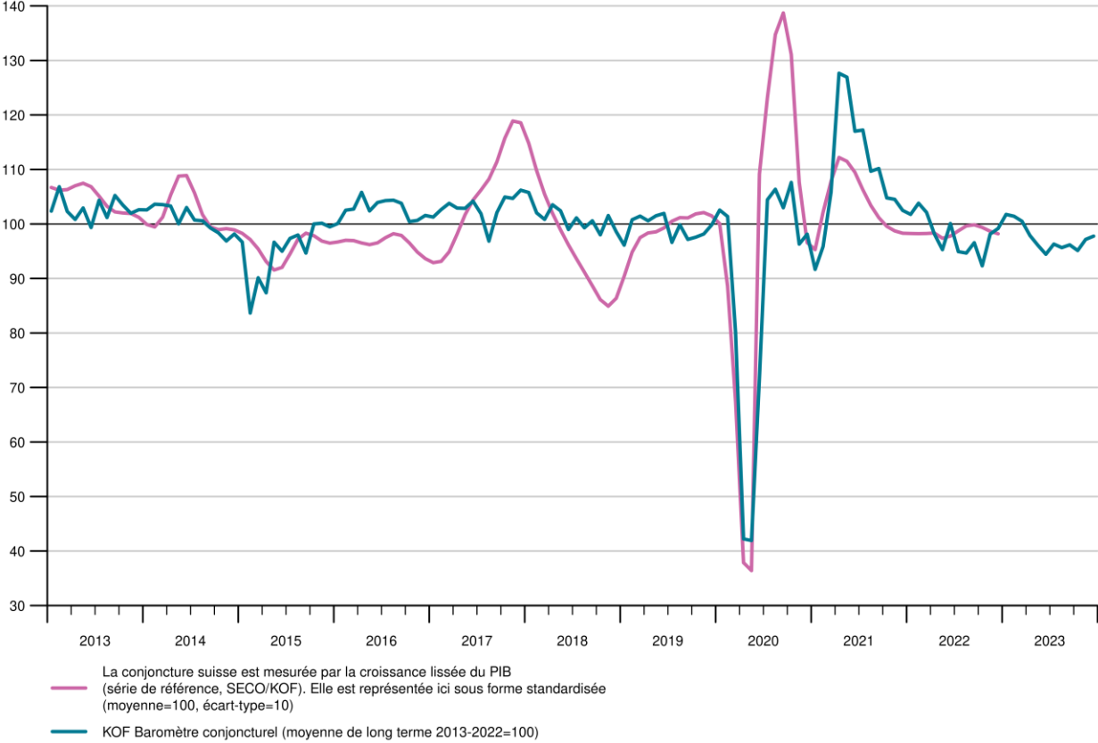
KOF Baromètre conjoncturel et série de référence