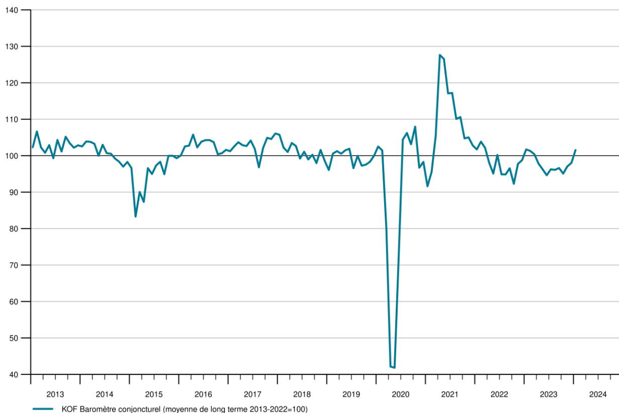
KOF Baromètre conjoncturel