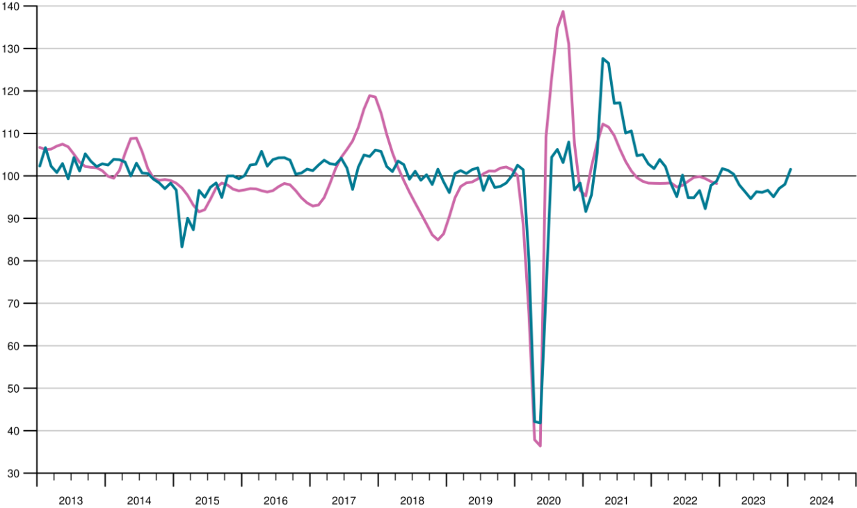
KOF Konjunkturbarometer und Referenzreihe

Die Schweizer Konjunktur, gemessen anhand des geglätteten BIP-Wachstums (Referenzreihe, SECO/KOF), welches hier standardisiert dargestellt ist (Mittelwert=100, Standardabweichung=10) — KOF Konjunkturbarometer (langfristiger Durchschnitt 2013-2022=100)