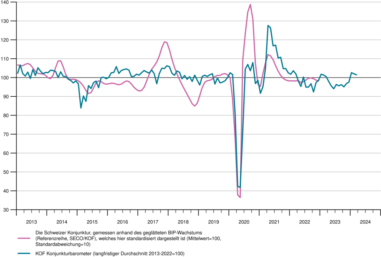
KOF Konjunkturbarometer und Referenzreihe