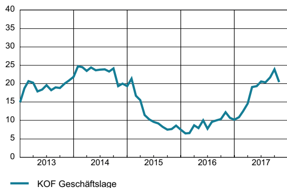
KOF Geschäftslageindikator (Saldo, saisonbereinigt)