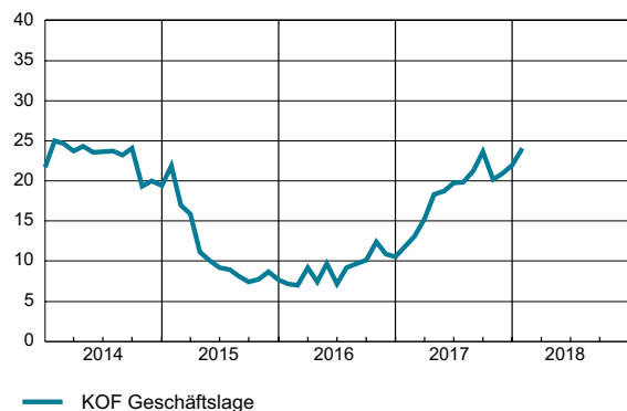
KOF Geschäftslageindikator (Saldo, saisonbereinigt)