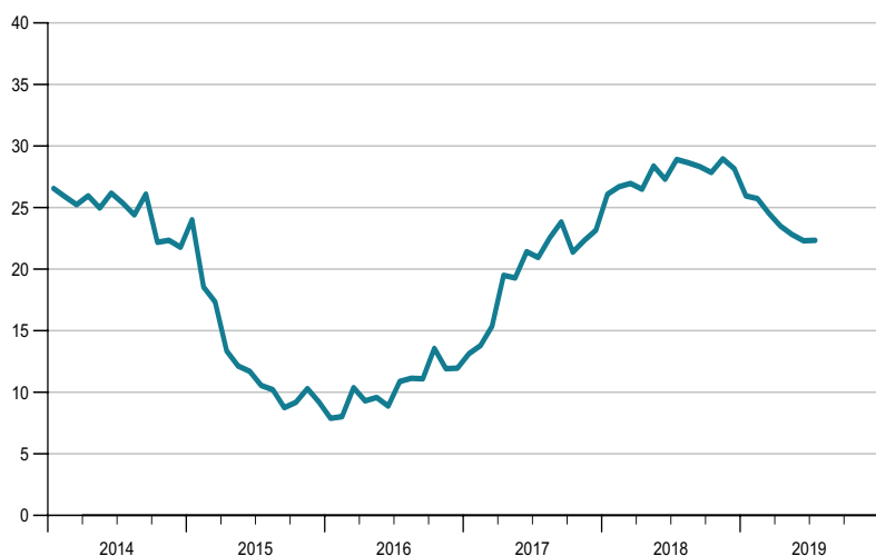
KOF Indicateur de la situation des affaires (solde, valeur désaisonnalisée)