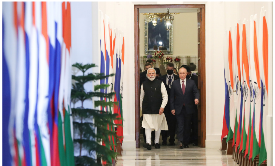
Der russische Präsident Wladimir Putin bei einem Treffen mit dem indischen Premierminister Narendra Modi in Neu-Delhi am 6. Dezember 2021.

Die Weigerung, sich den internationalen Verurteilungen Russlands anzuschliessen, scheint Indien bislang nicht zum Nachteil zu gereichen. Seit dem Beginn der russischen Invasion wird Indien von den USA, China, Russland und Europa umworben, welche versuchen, Neu-Delhis Position zu beeinflussen. Dies spiegelt Indiens wachsende strategische Bedeutung in einer Zeit wider, in der sich der wirtschaftliche, politische und militärische Schwerpunkt weiter nach Asien verschiebt. Indien könnte die Rolle eines globalen Swing State zufallen, der das Gleichgewicht der Kräfte ent-