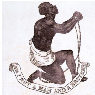
'Am I Not a Man and a Brother?' - Nach J. Wedgwood