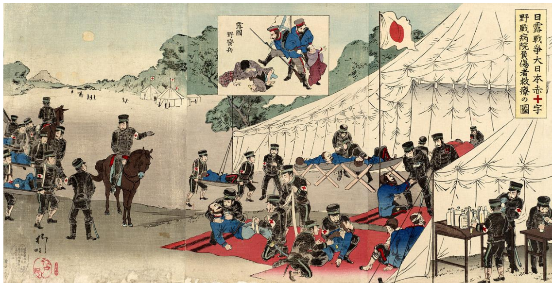
'Russo-Japanese War: Great Japan Red Cross Battlefield Hospital treating Injured', von Utagawa Kokunimasa, März 1904 (Sharf Collection, Museum of Fine Arts, Boston)