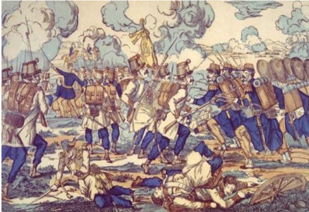
Die Schlacht von Solferino