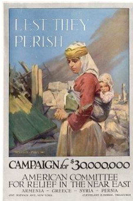
‘Lest they perish’, c. 1914-18, American Committee for Armenian and Syrian Relief