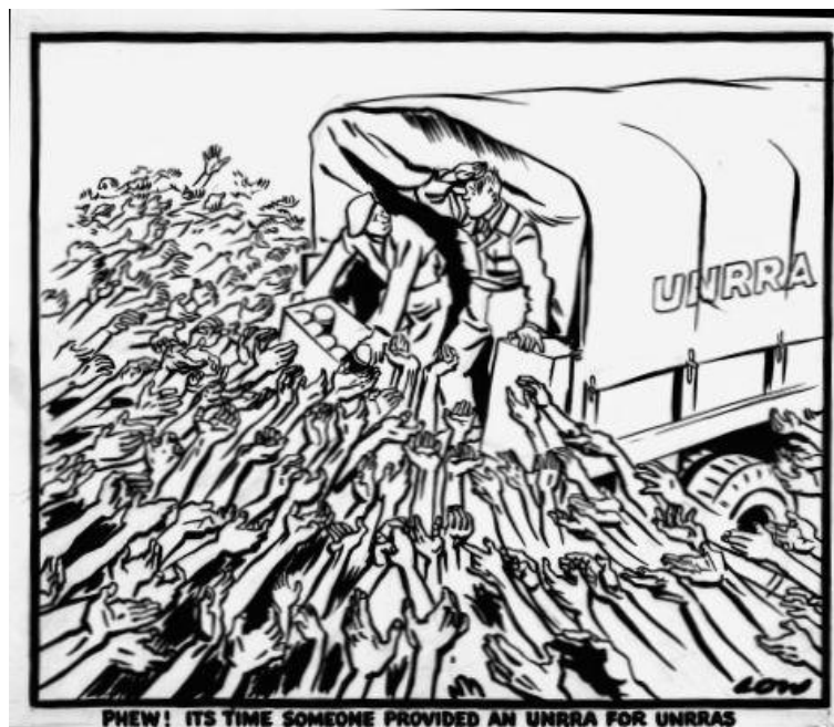
David Low (16.01.1946): Evening Standard