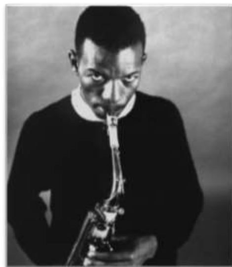
Angry young man? - Ornette Coleman, Speerspitze des 'Freejazz' oder 'New Thing'(1960)