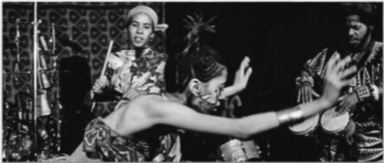
Freedom Jazz Dance — Performance des avantgardistischen Jazzkollektivs The Pyramids (1974)