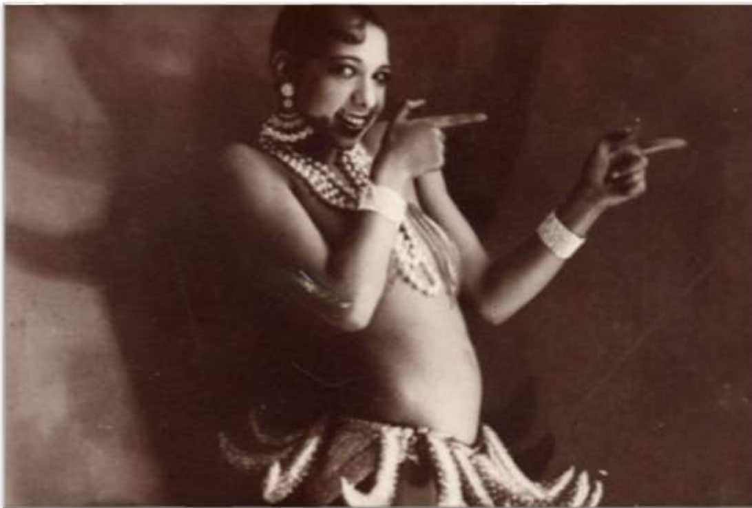
New Orleans sur Seine? — Josephine Baker auf der Bühne in Paris (ca. 1925)