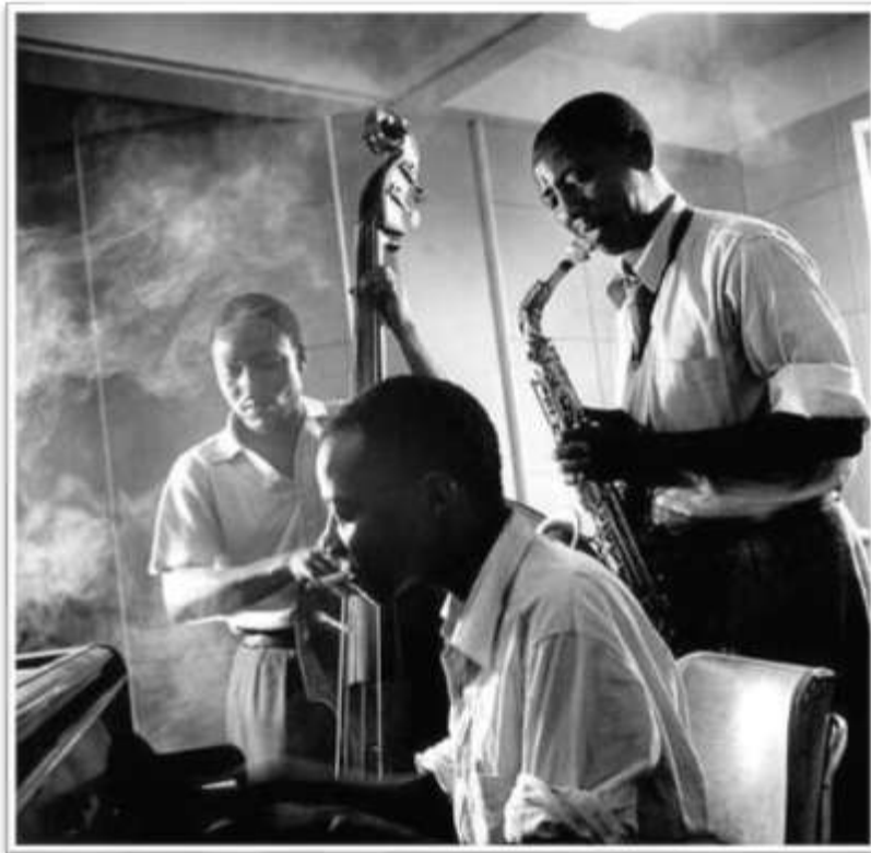
Jazzmusiker in Sophia Town (Johannesburg), Südafrika 1957