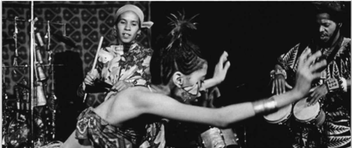
Freedom Jazz Dance — Performance des avantgardistischen Jazzkollektivs The Pyramids (1974)