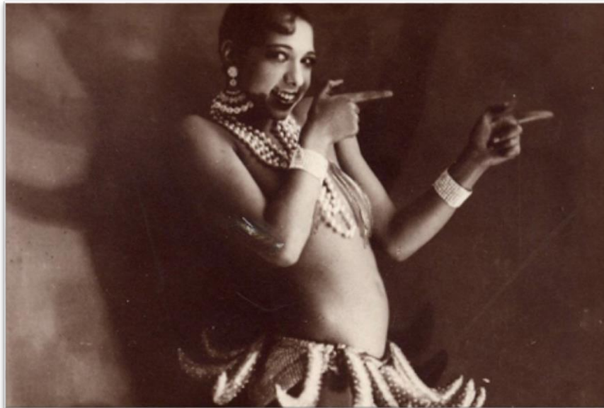
New Orleans sur Seine? — Josephine Baker auf der Bühne in Paris (ca. 1925)