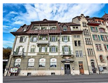
Das Bierhübeli.