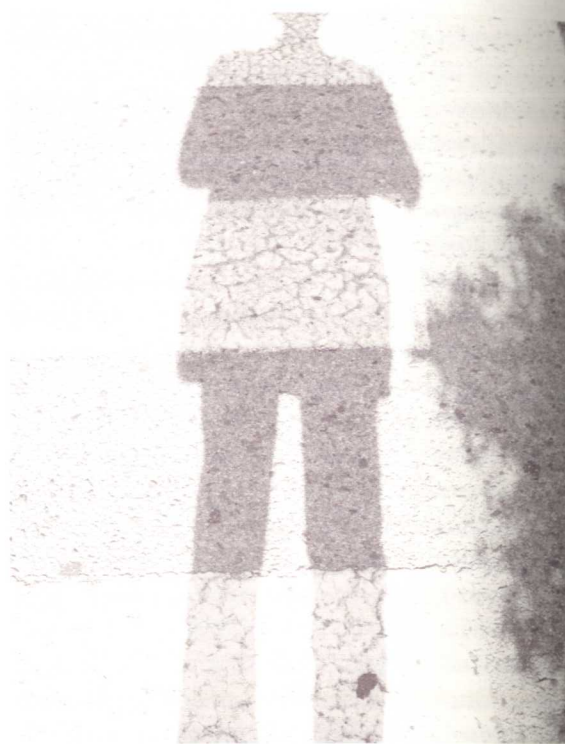
»Ein Schatten meiner selbst«, Sevilla, Flughafen, 2009.

»Sie hat einen Schatten« ist eine nicht nur zwei-, sondern vieldeutige Aussage, es könnte ja im passenden Kontext zum Beispiel auch ein »Kurschatten« gemeint sein. Wissenschafts- und technikgeschichtlich spielen Schatten im 20. Jahrhundert eine immense Rolle. Röntgenbilder sind Aufnahmen, die erwartbare Schatten zeigen – wie beim menschlichen Körper das Skelett –, aber auch unerwartete wie bei Gemälden Übermalungen. Röntgenstrukturanalyse ist eine starke Methode der Kristallographie. Vieles mehr ließe sich aufzählen, wenn man alle Strahlungsphänomene durchmusterte. Aber wäre die Metapher »Schatten« dann nicht doch überzogen?