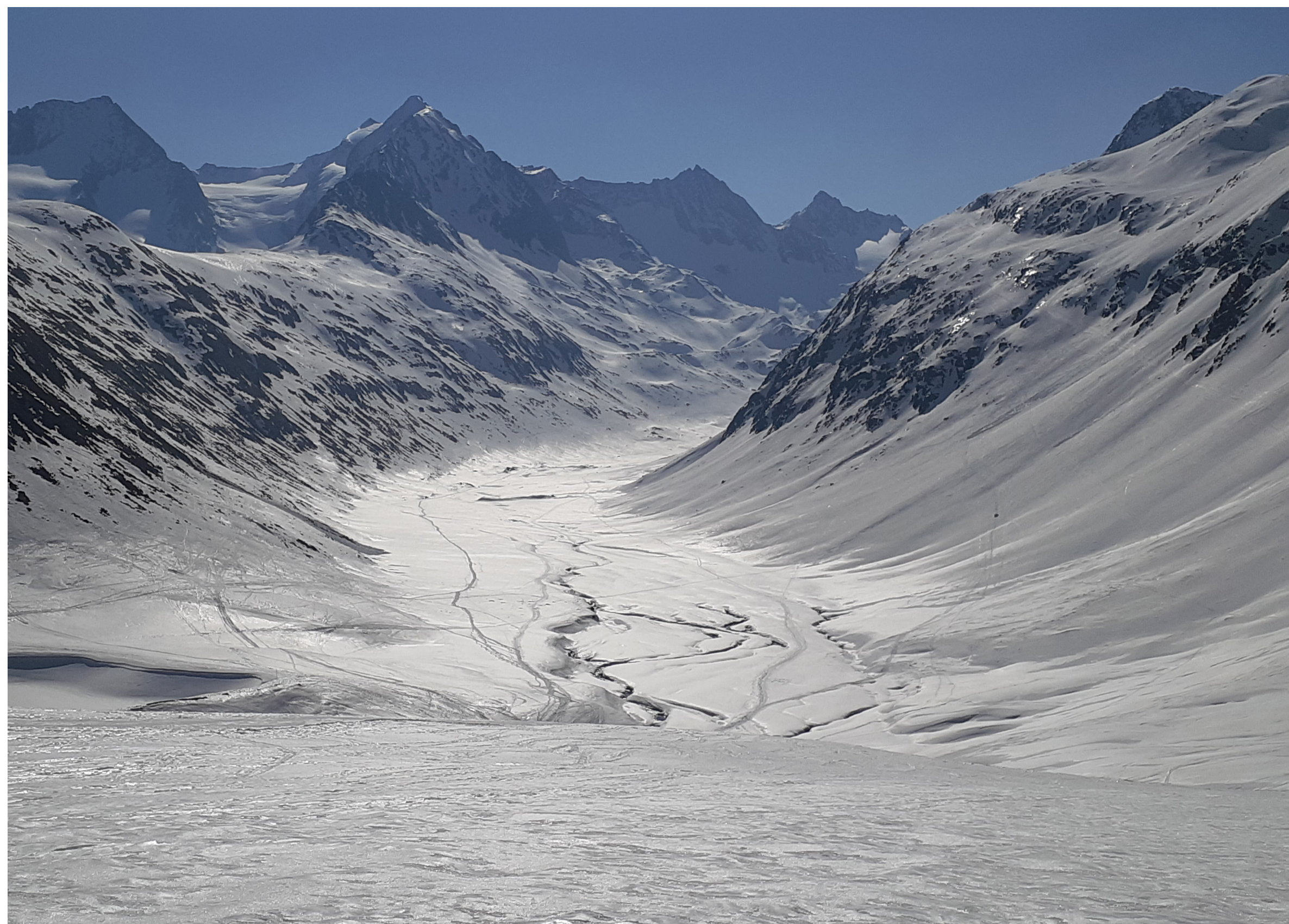
Fluslandschaft Oberurgl, Tirol