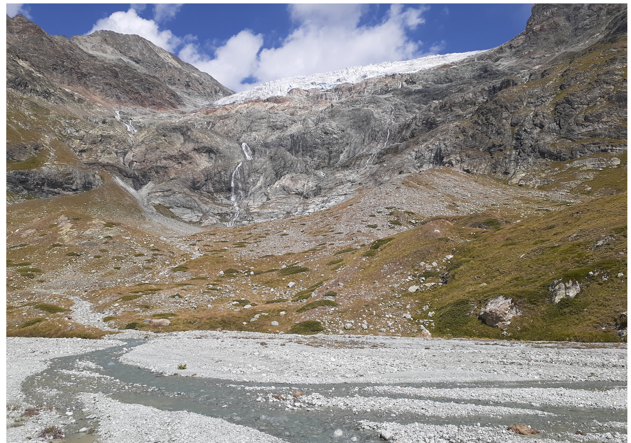
Gletscher Fluss Zermatt