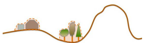
Bild 2: _____